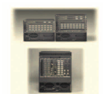
그림 4 Cisco Catalyst 6506, 6509 및 6509-NEBS

6-슬롯 Cisco Catalyst 6506과 9-슬롯 Cisco Catalyst 6509는 다수의 와이어링 클로짓과 코어 네트워크(그림 4 참조) 구축에 적합한 중급 포트 밀도를 제공합니다.