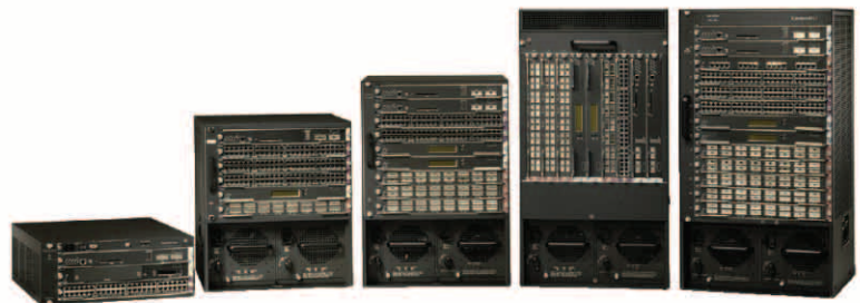
그림 1 Cisco Catalyst 6500 시리즈 WS-6503, WS-C6506, WS-C6509, WS-C6509-NEBS 및 WS-C6513

Cisco Catalyst 6500 시리즈는 뛰어난 확장성, 가격 경쟁력 및 성능을 제공하며, 다음과 같은 다양한 인터페이스 밀도, 성능 및 고가용성 옵션을 지원합니다: