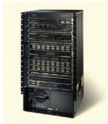
그림 3 Cisco Catalyst 6513

6-슬롯 Cisco Catalyst 6506과 9-슬롯 Cisco Catalyst 6509는 다수의 와이어링 클로짓과 코어 네트워크(그림 4 참조) 구축에 적합한 중급 포트 밀도를 제공합니다.