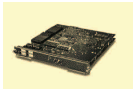
1-포트 OC-48c/STM-16 POS 옵티컬 서비스 모듈

Cisco Catalyst 6500 시리즈는 CWDM(coarse wave-division multiplexing)과 10-Gb 이더넷 기술은 물론 MPLS(EoMPLS), MPLS VPNs 및 MPLS QoS 이더넷을 포함한 뛰어난 MPLS(Multiprotocol Label Switching) 프로토콜을 지원하므로, 서비스 제공 업체들은 고도로 안전한 연결, Diff-Serv(Differentiated Services) 및 QoS 보장 등과 같은 확장 가능하고 유연한 서비스를 고객들에게 제공할 수 있습니다. 시스코 시스템즈는 메트로 서비스가 업계에서 주목 받기 전에 이를 이미 개발하고 공급하는 데 앞장 섰습니다. 새로운 프로토콜 및 기술의 개발은 물론 IETF(Internet Engineering Task Force)를 포함하는 각종 표준화 단체에 적극 주도적으로 참여해 온 시스코는 서비스 제공 업체들이 현재 당면하고 있는 고객들의 실제 요구를 해결할 수 있도록 도울 수 있습니다. 시스코 시스템즈는 서비스 제공 업체들이 수익성 있는 부가가치 서비스를 고객들에게 제공할 수 있는 기술을 제공함으로써 WAN과 메트로 이더넷 시장을 계속 주도할 것입니다.