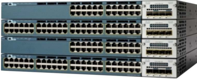
그림 2. Cisco Catalyst 3560-X Series 스위치

표 2는 Cisco Catalyst 3560-X Series의 구성을 보여줍니다.