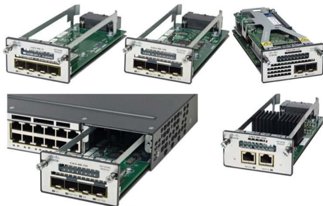
그림4. GbE 4개, 10GbE SFP+ 인터페이스 2개, 10GB-T 2개, 서비스 모듈(10GbE SFP+ 인터페이스 2개)로 구성된 다양한 네트워크 모듈

그림4는 GbE 4개, 10GbE SFP+ 인터페이스 2개, 10GB-T 2개, 서비스 모듈(10GbE SFP+ 인터페이스 2개)로 구성된 다양한 네트워크 모듈을 보여줍니다.