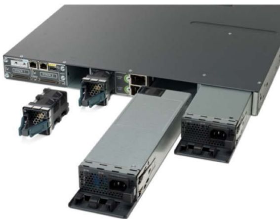
그림 5. 듀얼 리던던시형 전원 공급 장비

표 6은 이러한 스위치에 사용할 수 있는 다른 전원 공급 장비와 사용 가능한 PoE 전원을 보여줍니다.