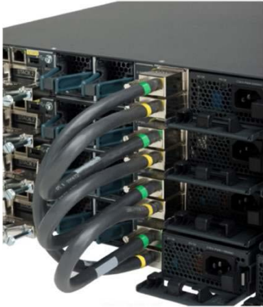
그림 3. StackPower 커넥터

StackPower는 전력 공유 모드 또는 리던던시 모드에서 설치할 수 있습니다. 전력 공유 모드에서는 하나의 스택에 해당하는 모든 전원 공급 장비의 전원이 통합된 후 스택 내 다른 스위치로 분산됩니다. 리던던시형 모드의 경우, 스택의 총 전력 예산을 계산할 때 최대 전원 공급 장비의 전력량(와트)은 포함시키지 않습니다. 최대 전력은 예비로 비축되었다가 전원 공급 장비 하나에 장애가 발생했을 때 스위치 및 연결된 다른 장비의 전원을 유지하는데 사용됩니다. 따라서 중단 없이 네트워크를 운영할 수 있습니다. 하나의 전원 공급 장비에 장애가 발생하면 StackPower 모드가 전원 공유 태세로 바뀝니다.